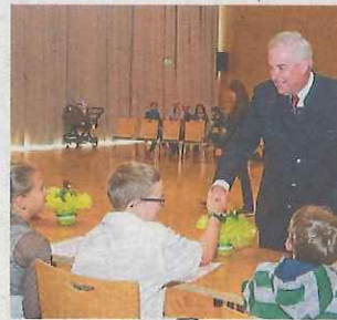
Der Landeshauptmann gab dem Kindergemeinderat die Ehre

Die Kinder der 3. und 4. Klasse der Volksschule sowie der 1. und 2. Klasse der NMS zeigten sich bei einer Vorstellungsrunde am 7. April sehr interessiert an einer Tätigkeit im Kindergemeinderat. Schließlich ha-