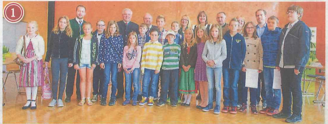
Der Langenwanger Kindergemeinderat wurde angelobt

LANGENWANG. Im Volkshaus in Langenwang findet am Sonntag, dem 16. Oktober, eine Welpencollege-Trainiertagung statt. Die Tagung wird als Fortbildung für tierschutzqualifizierte Hundetrainer mit sieben Fortbildungsstunden anerkannt. Anmelden kann man sich noch bis 30. September auf der Homepage www.royal-canin.at .