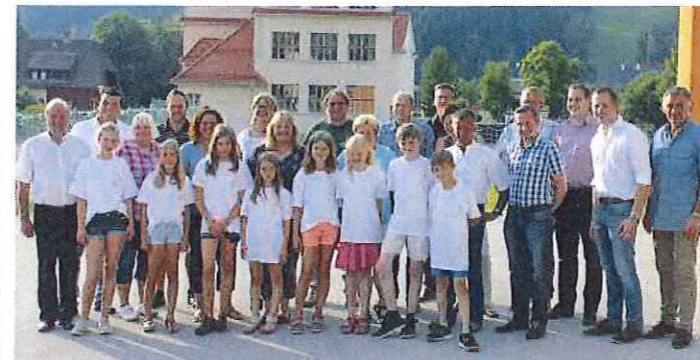
Gemeinsame Sitzung des Kinder- und Erwachsenengemeinderates in Langenwang. Die jungen Ortschefs zogen Bilanz.