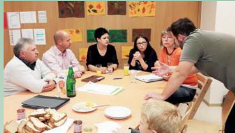
Projektgruppe „Landwirtschaft und Nahversorgung“