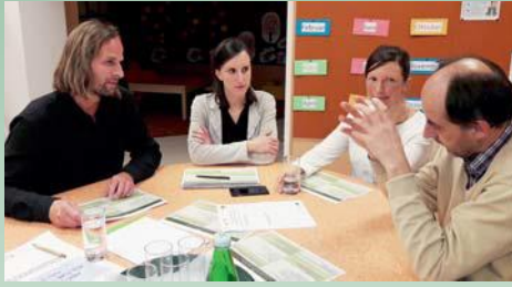
Projektgruppe „Hengsberger Kulturprogramm“