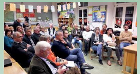
Teilnehmer der Projektwerkstätte

ge (mittel- bzw. langfristig) Projekte für die strategische Ausrichtung der Gemeinde in einem Aktionsplan angeführt und finden in die Erstellung der neuen Gemeindestrategie Eingang. Detaillierte Ergebnisse zum Beteiligungsprozess finden Sie auch auf der Gemeindehomepage.