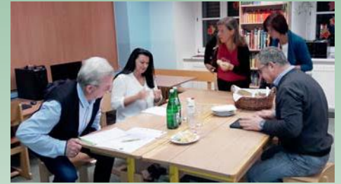
Projektgruppe „Hengsberger helfen Hengsbergern“