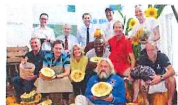
Der Kürbis stand im Mittelpunkt beim Start zum Genussherbst in der Parktherme.