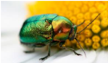
Käfer sind die größte Insektengruppe.

Die Anzahl der Insekten nimmt immer mehr ab. Hauptgründe dafür sind Klimawandel, intensive Landnutzung und der Verlust von Nahrungsangebot und Lebensraum. Dank des Naturschutzbundes ist es jetzt möglich, tiefer in die Welt der Insekten einzutauchen. Allein in Österreich gibt es etwa 40.000 Insektenarten. Zudem sind die Krabbeltiere oftmals Rekordhalter in vielen Disziplinen: Die Kleinsten unter ihnen sind nur einen Bruchteil eines Millimeters groß, wohingegen die größten Vertreter mit bis zu 50 Zentimetern Länge wahre Riesen sind.