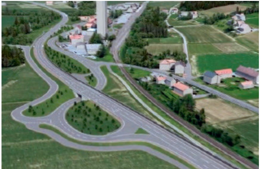
Entwurf - Unterführung Fladnitz

Die Umweltverträglichkeitsverfahren (UVP) befinden sich in der finalen Phase. In den ersten August Wochen finden die Einzelgespräche mit betroffenen Grundeigentümern in der Gemeinde statt. Im Sommer erfolgen Gespräche mit den Verantwortlichen der ÖBB bezüglich Eisenbahnquerungen sowie mit der Agrarbezirksbehörde werden eventuelle