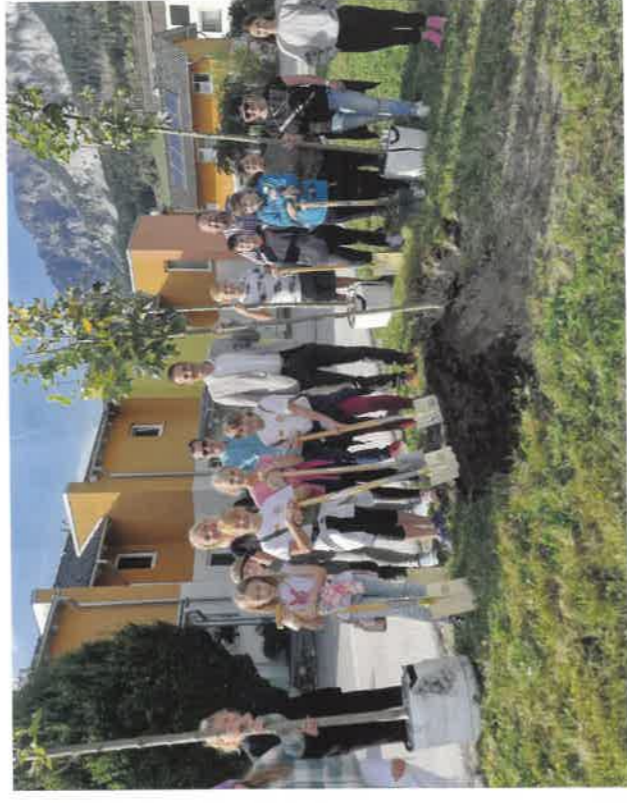
Umsetzung der Projekte des Gröbminger Kindergemeinderates: Bäume verschönern den Ahornweg.

Auch ein neuer öffentlicher Spielplatz ist bereits auf Schiene und wurde in beiden Gemeinderäten beschlossen. Der Kindergemeinderat entwickelte gemeinsam mit